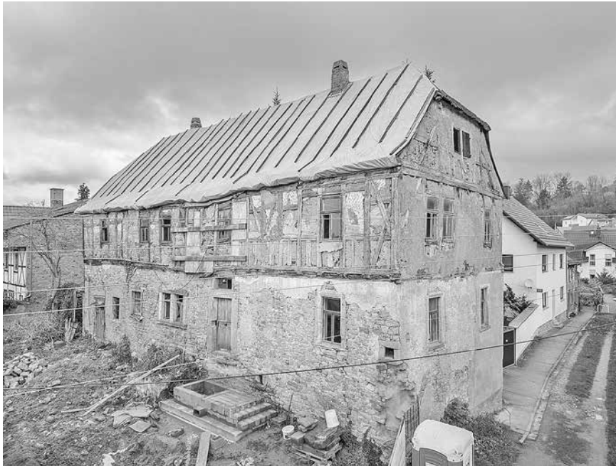
Das Raspehaus ist mehr als 400 Jahre alt und eines der ältesten Wohnhäuser im Landkreis Sömmerda