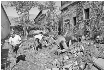
Bei Arbeitseinsätzen werden die Mitglieder des Fördervereins auch selbst aktiv, beräumen das Gelände und bergen Schutt aus dem Gebäude