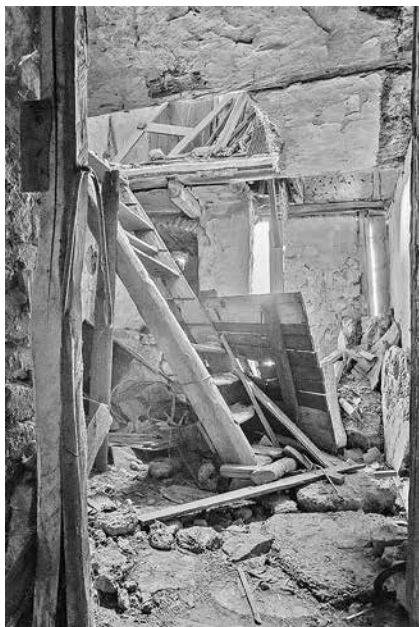
Die Bausubstanz ist an vielen Stellen im Gebäude erheblich in Mitleidenschaft gezogen, teilweise kann durch die Decken bis ins Dachgeschoss geblickt werden

Mittlerweile ist der Verein auf 30 Mitglieder angewachsen. Sie kommen aus der Region, aber auch aus Jena, Köln oder der Schweiz. Mit vereinten Kräften und unter dem Motto „Gemeinsam geht mehr“ leiteten sie u. a. erste (Winter-)Notsicherungs-