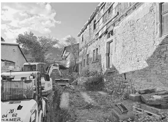
Im Rahmen der Baumaßnahmen wurde das Außengelände beräumt und auch die Zuwegung zum Gebäude instandgesetzt

Inzwischen hat der Verein, auch mit Unterstützung aus der Bürgerschaft, ein nachhaltiges Nutzungskonzept für das Raspehaus entwickelt und in Workshops bereits öffentlich diskutiert. Die Pläne sehen vor, im historischen Gewölbekeller des zweigeschossigen Hauses einen Weinkeller einzurichten. Im Erdgeschoss soll nach Vorstellungen des Vereins „eines der ältesten europäischen Kurcafés“ entstehen, das laut historischen Überlieferungen einst in Rastenberg existiert haben soll. Im Obergeschoss soll zukünftig ein Verwaltungsmuseum über die Entwicklung des Staatswesens informieren. Mit einem Eventraum im Dachgeschoss möchte der Verein die Kultur im ländlichen Raum beleben und zum Außenlernort für Schulen und Kitas mit Blick auf Heimatgeschichte werden.